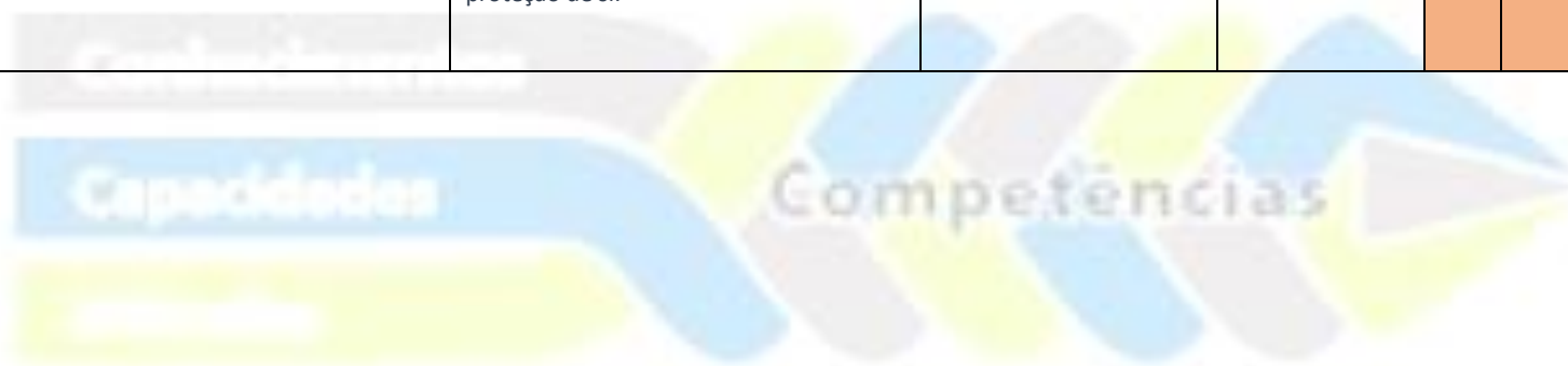
Figura 2 – Esquema conceitual de competências do projeto 2030/da OCDE (adaptado).