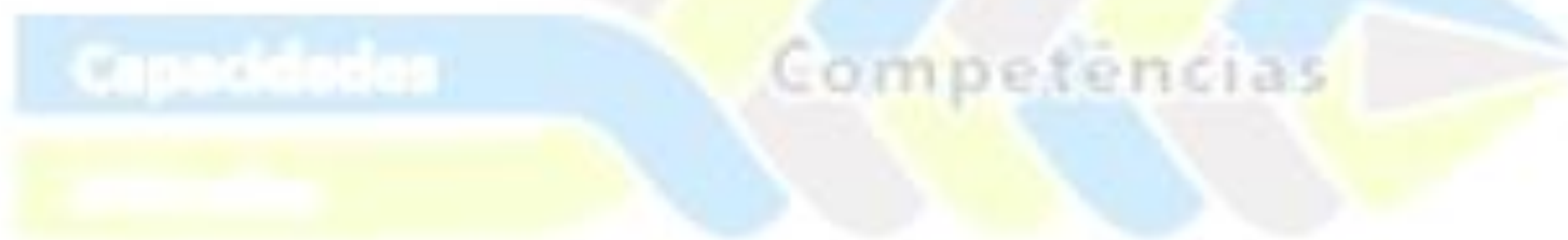
Figura 2 – Esquema conceitual de competências do projeto 2010/11 da OCDE (adaptado).